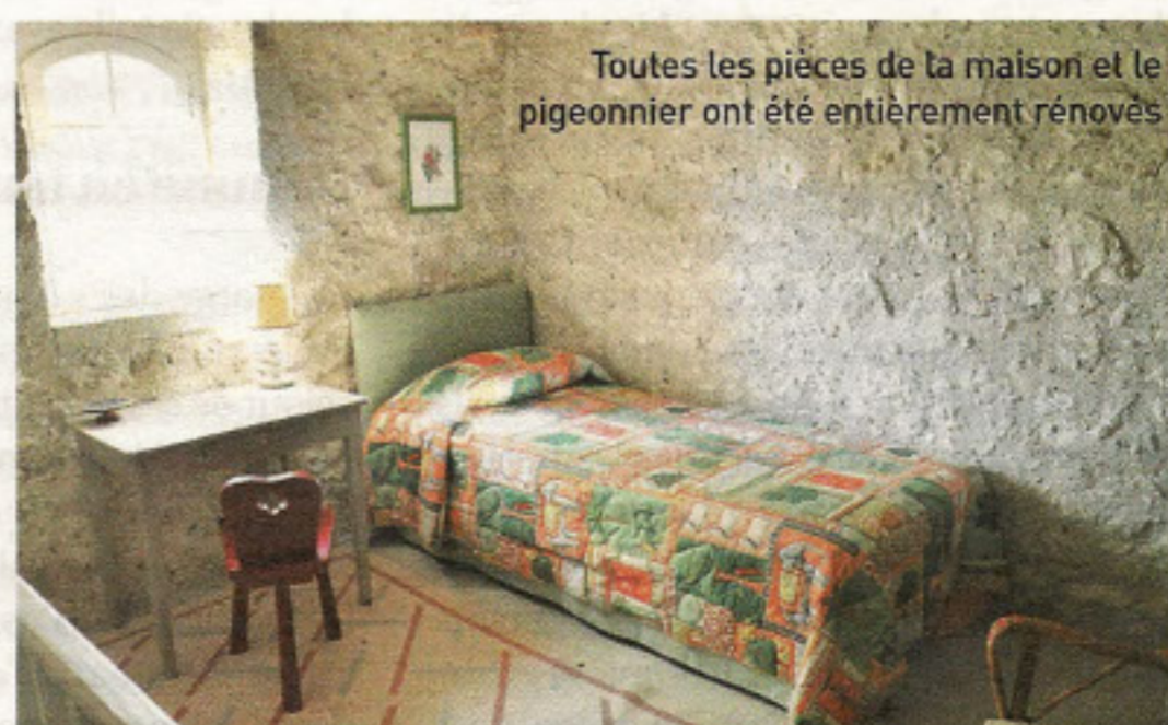
Toutes les pièces de la maison et le pigeonnier ont été entièrement rénovés