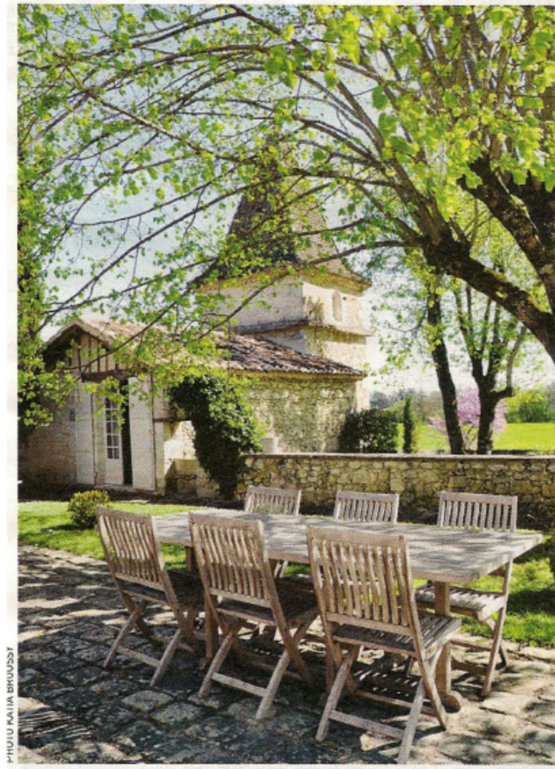
Ci-dessus, le pigeonnier et sa terrasse

Et quoi de mieux comme écrin que cette splendide maison gersoise dans laquelle